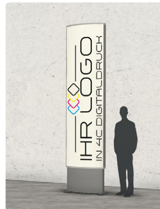
900 x 3480 mm