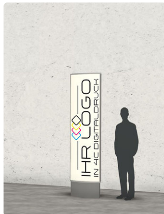
705 x 2500 mm