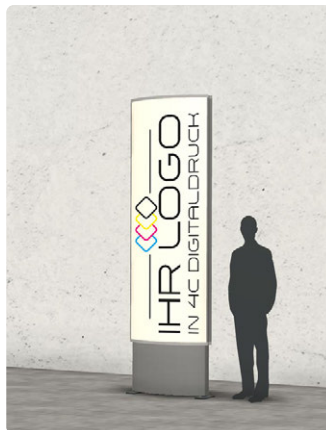
900 x 3000 mm